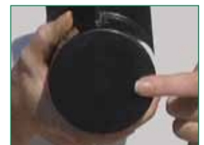
Nach der Reinigung der Oberfläche des Wandlers.

BITTE LESEN UND FOLGEN SIE VOR DER INSTALLATION IHRES GERÄTS allen Anweisungen in der Bedienungsanleitung.