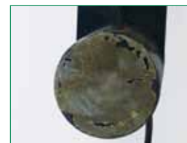
Vor der Reinigung der Oberfläche des Wandlers.